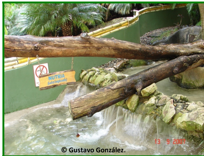
Vista Lateral del Albergue