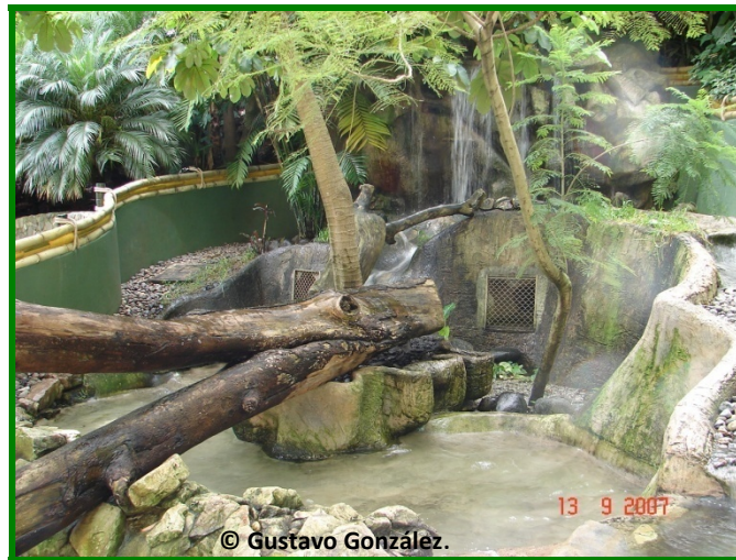
Vista Frontal del Albergue