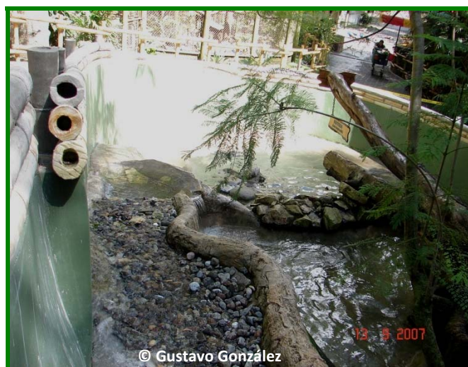
Vista posterior del Albergue